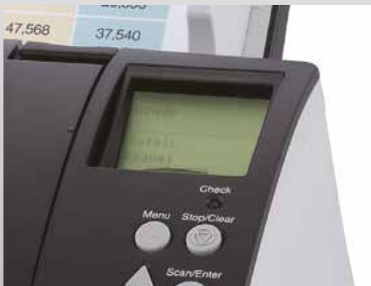
Panel de funcionamiento con pantalla de cristal líquido integrada

Los fi-7180, fi-7280, fi-7160 y fi-7260 incorporan funciones de administración central que los administradores de sistemas pueden utilizar para gestionar la instalación y funcionamiento de múltiples escáneres, monitorizar el estado de funcionamiento y actualizar los controladores y el software desde una única ubicación. Esta funcionalidad reduce drásticamente el coste y el trabajo requeridos en la configuración, funcionamiento y mantenimiento de un gran número de escáneres en una misma organización y también en la expansión de la red de escáneres a múltiples ubicaciones.